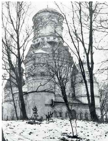
Церковь Иоанна Предтечи в селе Дьякове. Здесь служил отец священномученика, а после его смерти сам отец Сергей. В 1923 году храм был закрыт

Прихожане в ответ направили властям заявление с просьбой об оставлении хотя бы Казанской церкви. Ходатайство их было на этот раз удовлетворено. Однако на пороге уже стояли широкомасштабные гонения на Русскую Православную Церковь, и в ночь с 15 на 16 марта 1932 года отец Сергей и вместе с ним семь прихожан-крестьян были арестованы. Тюрем тогда не хватало, и первое время арестованных содержали в специально устроенном на этот случай концлагере в селе Царицыне. Священника и крестьян обвинили в том, что они распространяли антисоветские слухи, источником которых был, в частности, подросток, житель села Дьяково, рассказывавший, что однажды, когда он ехал из Москвы, то у местечка близ Перервы, называемого Иоанн Богослов, ему повстречался незнакомый старик и попросил подвезти его. Вскоре старик предложил ему оглянуться назад. Обернувшись, тот увидел, что по дороге рекой течет кровь, а над Москвой мчится конница. Старик предложил посмотреть в правую сторону. Там была группа работающих крестьян-единоличников. Мальчик посмотрел налево. Здесь стояли колхозники, одетые в походящие на саваны желтые халаты, а впереди них шла толпа с музыкой. Хотел было мальчик расспросить старика, но того уже не было. Вызванный на допрос в ОГПУ, он подтвердил, что действительно все это видел. «Что это был за старик, я совершенно не знаю», - завершил он свой рассказ. «Кто тебя научил распускать подобные слухи?» - спросил его следователь. «Никто меня не учил», - ответил подросток.