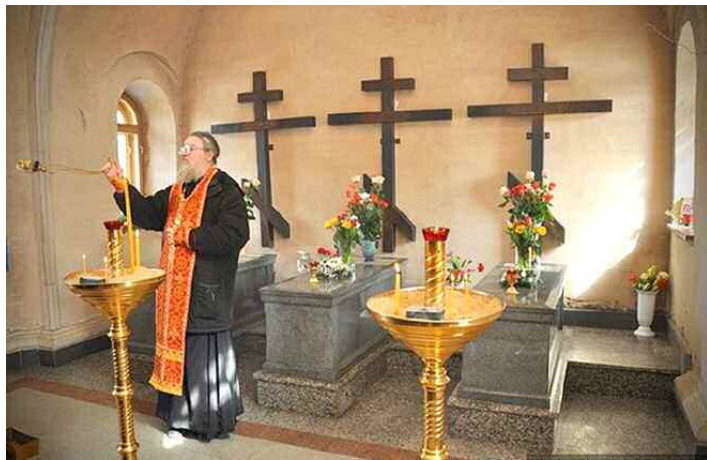
Место погребения Оптинских новомучеников.

Мы сознаем, как далека наша жизнь от святости этих мучеников. Но они говорят всем ищущим Господа: «Не бойтесь». Не следует сравнивать себя ни с кем. Каждый из нас, как бы ни был он мал, велик перед вечностью. Бог хочет установить с каждым человеком единственные и сокровенные отношения. Неудивительно, что многие сегодня из тех, кто стремится, по слову апостола, сражаться до крови, подвизаясь против греха, обращаются за помощью к ним. Они победили Пасхой Господней, которая дала им вечную жизнь. До окончания века, до Второго Пришествия Христова будет идти сражение сил зла против сил любви, сил тьмы против сил света. Это сражение становится особенно ожесточенным после Воскресения Христова. Напряжение его будет возрастать по мере приближения Дня Господня - всеобщего воскресения мертвых. Можно даже усомниться порой в конечном исходе - так силы зла возобладают в мире. Но Воскресение Христово, Его победа над смертью ясно показывают, что силы любви решительно восторжествуют.