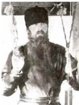
Ангел молчания (Отец Ферапонт)

Рассказывали, что когда на могилку о. Трофима приехал его брат, он в недоумении сказал: «Как же так, ты умер...». То есть у него в голове это не укладывалось. И тогда он явно услышал: «Любовь, брат, не умирает...»