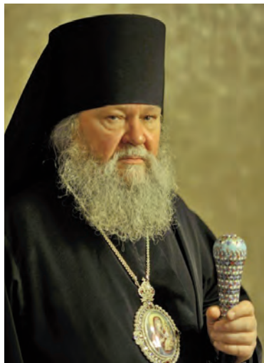
Епископ Великолукский и Невельский Сергий: «Будущее храма в погосте Клин вызывает опасения».

(Окончание. Начало на стр. 1) К сожалению, время ра-