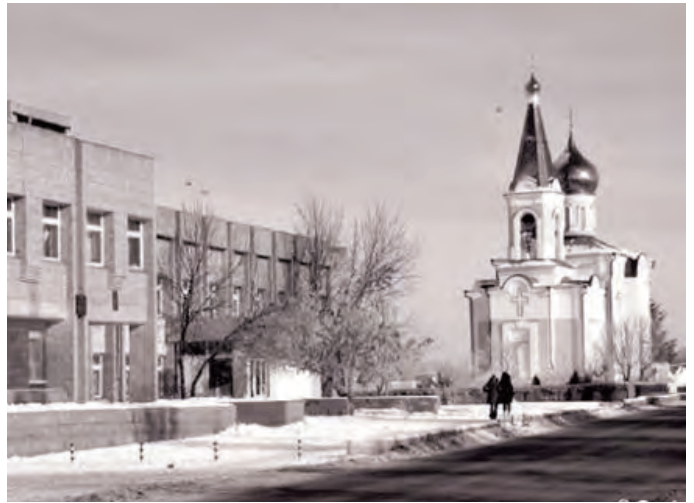
В 1931 году, через год после подавления мятежа, вызванного массовым протестом против выселения крестьян, церковь села Началово была разрушена. Только в 2005 году началось ее восстановление.